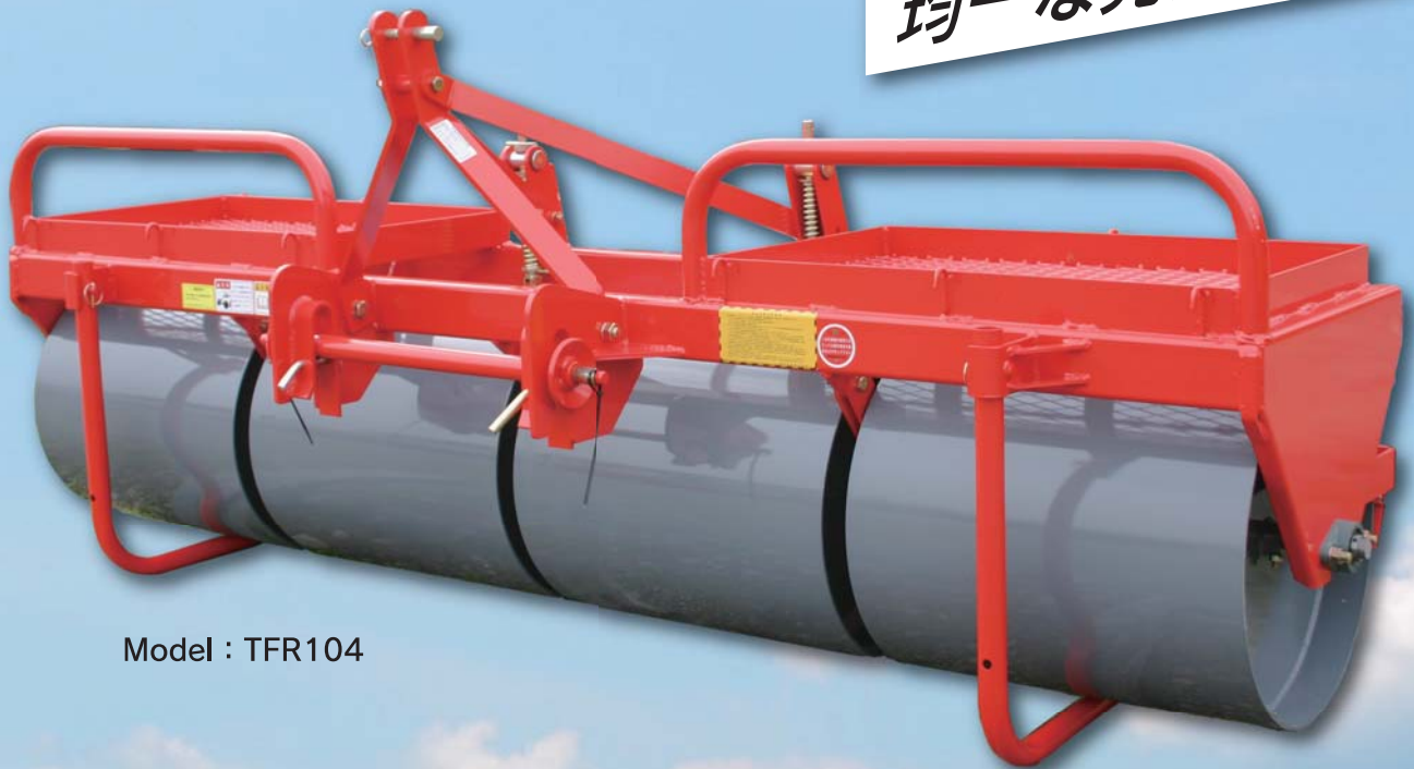
Model : TFR104