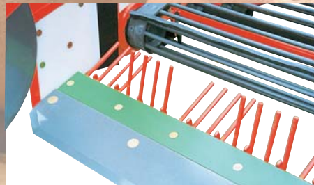
安全性の高いスリット状掘取刃