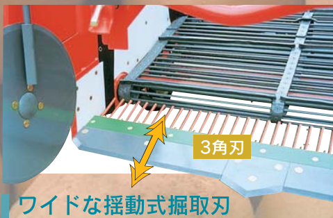
ワイドな揺動式掘取刃