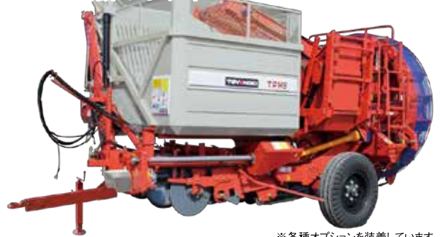
※各種オプションを装着しています。